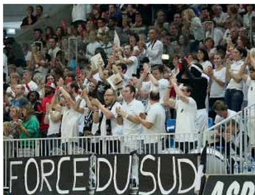
Le T71 méritait bien cette appellation hier soir!